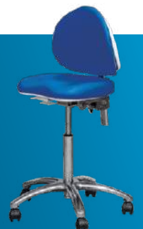
Taburete S408 Movimiento de asiento y respaldo