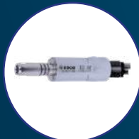
Micromotor neumático D17-M